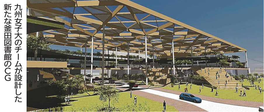
九州女子大のチームが設計した新たな釜田図書館のCG