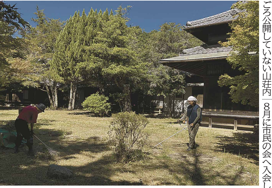
「百合野山荘」の庭掃除をする参加者

「スポGOMI」小倉北区で予選 W杯目指し16チーム スポーツ感覚でゴミ拾いを競う「スポGOMI」の世界大会に向けた福岡予選が、小倉北区の塚町公園や巨瀬市場であった。1チーム3人編成で計16チーム(48人)が参加し、空き缶やタバコの吸殻などを合わせて56・5kgのゴミを拾い集めた。 9月21日に開催された予選は、海洋ごみの削減に取り組む「海と日本プロジェクトinふくおか」の主催指定されたエリアで60分